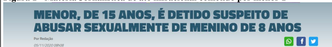
Figura 1 - Matéria Jornalística de ato infracional cometido por menor 1

online com repercussão na cidade de Arapiraca e região, em que fossem noticiadas matérias que tivessem menores de 18 (dezoito) anos como autores de um ato infracional e concomitantemente outros menores de 18 (dezoito) anos como vítimas, através das quais selecionamos os seguintes recortes para a análise: