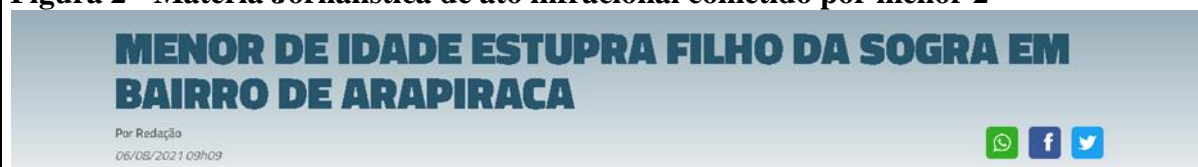
Figura 2 - Matéria Jornalística de ato infracional cometido por menor 2