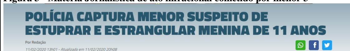
Figura 3 - Matéria Jornalística de ato infracional cometido por menor 3