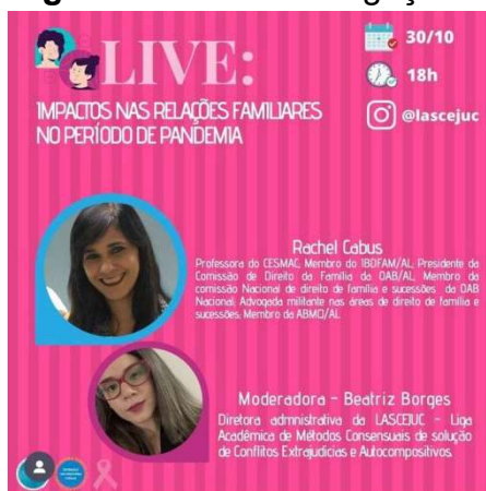
Figura 1: Arte de divulgação da live.