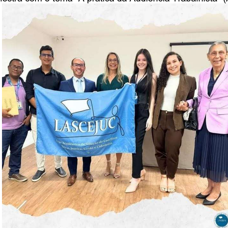
Figura 10: Palestra com o tema “A prática da Audiência Trabalhista” (Ano: 2024).