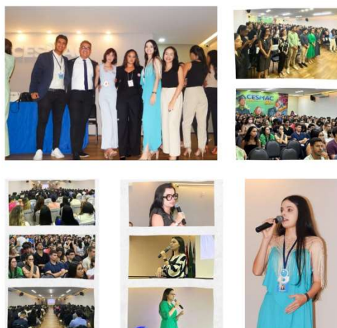
Figura 06: Palestra com o tema “Como se destacar na faculdade” (Ano: 2024).