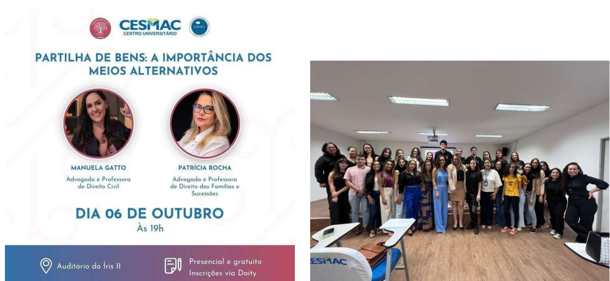
Figura 5: Arte de divulgação da palestra e foto durante o evento.

Fonte: Liga Acadêmica de Direito Lascejuc, 2023.