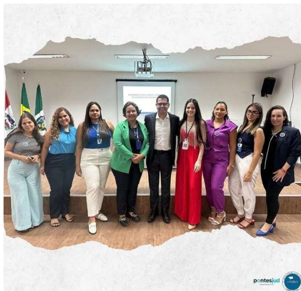
Figura 09: Palestra com o tema “Cobrança de Honorários Advocatícios” (Ano: 2024).