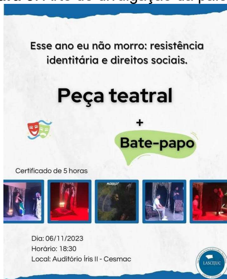
Figura 5: Arte de divulgação da palestra.