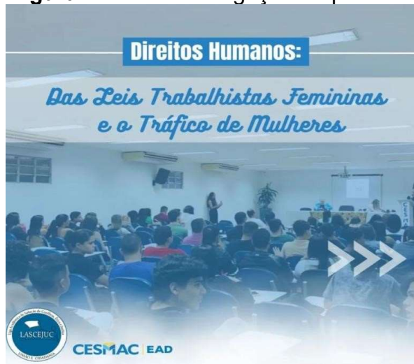
Figura 4: Arte de divulgação da palestra.