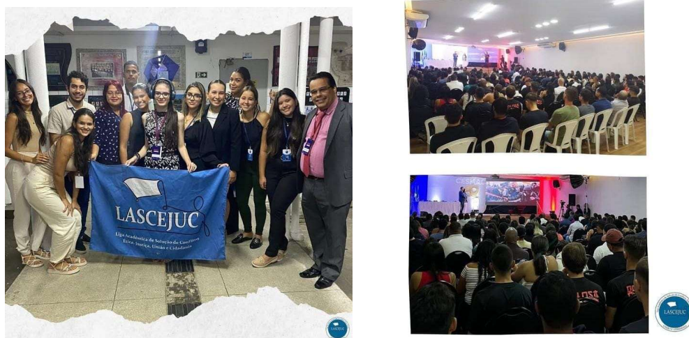
Figura 07: Palestra com o tema “DNA POLÍTICO: O que você precisa saber sobre os bastidores das eleições (Ano: 2024).