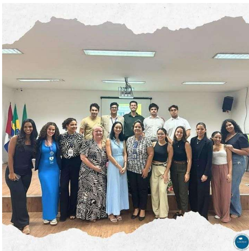
Figura 08: Palestra com o tema “Animais no Direito: Responsabilidade, Proteção Legal, Reconhecimento no Âmbito Civil e Principais Impactos na Sociedade” (Ano: 2024).