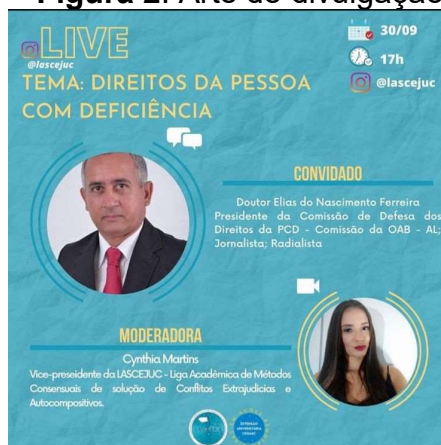
Figura 2: Arte de divulgação da live.