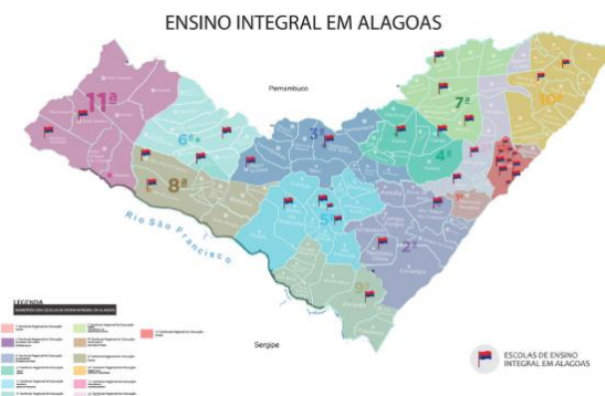
Figura 1 - Mapa das escolas em ensino integral em Alagoas.

Abaixo, mapa (FIGURA 1) contendo as 53 (cinquenta e três) escolas de ensino integral no Estado de Alagoas: